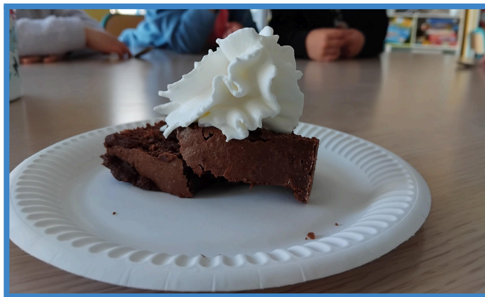
Pour se faire plaisir et faire plaisir !

Cet après midi les plus jeunes avaient choisi dessin en pointillés (ce choix revient souvent de la part des enfants)