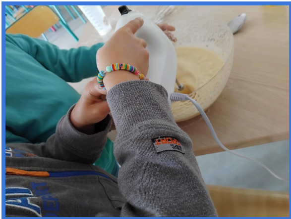
L'entraide, le travail en équipe ...